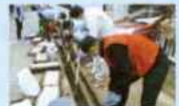
海浜町の災害ボランティアセンター 設置・運営