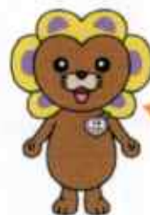
中原区社協PR大使 中原「ているん」

「おたがいさまのまちづくり」を目指し、様々な事業を行なっています。お気軽にお越し下さい!