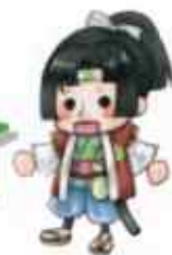
宮前区社協キャラクター 宮太郎