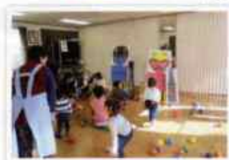
幸区社会福祉協議会 事務局の様子