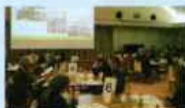
市社協・地ケア会議