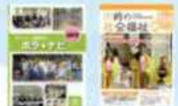
福祉に関する情報発信