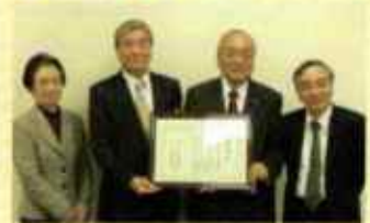
皆様寄付をいただいた皆様へ感謝状を贈呈しています。