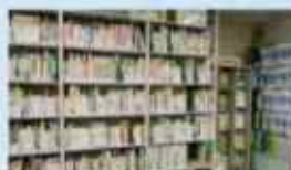
福祉関連図書・DVDの貸出し