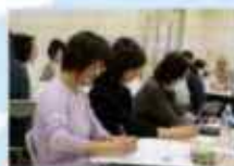
おんしんセンター 生活支援員研修会