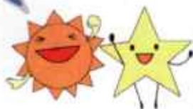
多摩区社会福祉協議会 キャラクター たいようさん&ほっしーくん