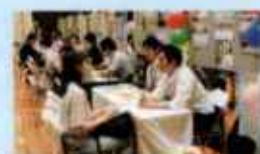
福祉のお仕事 就職・転職フェア