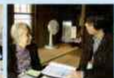
高齢者への相談対応 地域包括支援センター