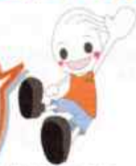
川崎区社会福祉協議会 キャラクター ウェーブくん

昨年、富士見へ 移転しました。 研修室も2つあります ので、ぜひご利用 ください。