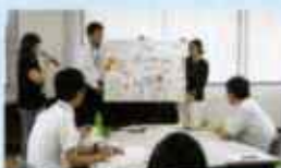
教職員向け福祉教育研修会