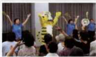
ヘルスパートナーの皆さんとデントラ体操