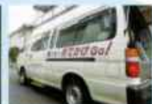
高齢者外出支援事業 おでかけGO!