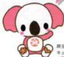
麻生区社協キャラクター キューちゃん

第3期麻生区地域福祉活動計画「ひと・ひと」福祉プランを作り、「みんなでささえあう、暮らしやすいまちづくり」を目標に、1「知り合う」2「ふれあう」3「ささえあう」という三つの柱を決めて、地域住民の方や区役所や福祉の仕事をしている方々と協力して福祉のまちづくりを進めています。