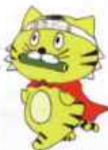
高津区社会福祉協議会 キャラクター デントラちゃん