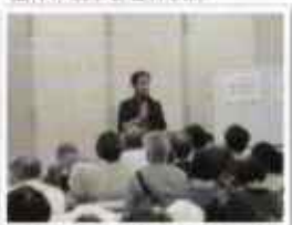
地域の関係づくりについての講演会