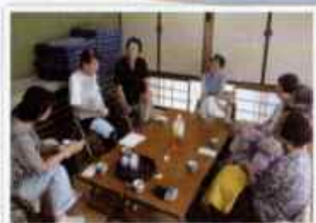
多摩区ボランティアセンター

4月25日に区役所通りの向ヶ丘遊園駅近くへ移転します。 皆さま、お気軽にお立ち寄りください！