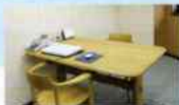
こころの健康相談室 ぶらーえむ