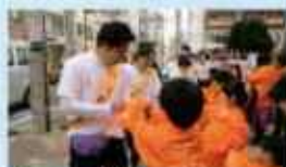
災害発生時防止運動