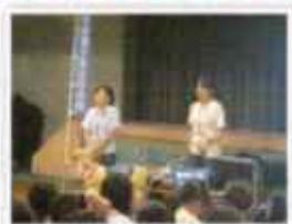
夏休み親子福祉探検隊

☎TEL: 952-5500 ✉E-mail:info@asao-shakyo.com