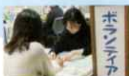
ボランティア相談