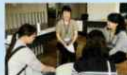
学生への就職相談会