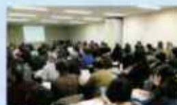
民生委員児童委員 研修会