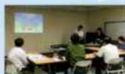
かわさき暮らしサポーター養成講座