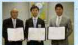
被災者支援活動充実のため 行政・他団体と協定締結