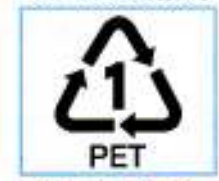
この表示のあるボトルが対象です