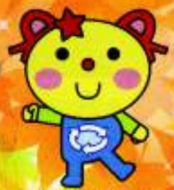
かわさき3R推進キャラクター かわるん