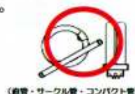
(直管・サークル管・コンパクト管)