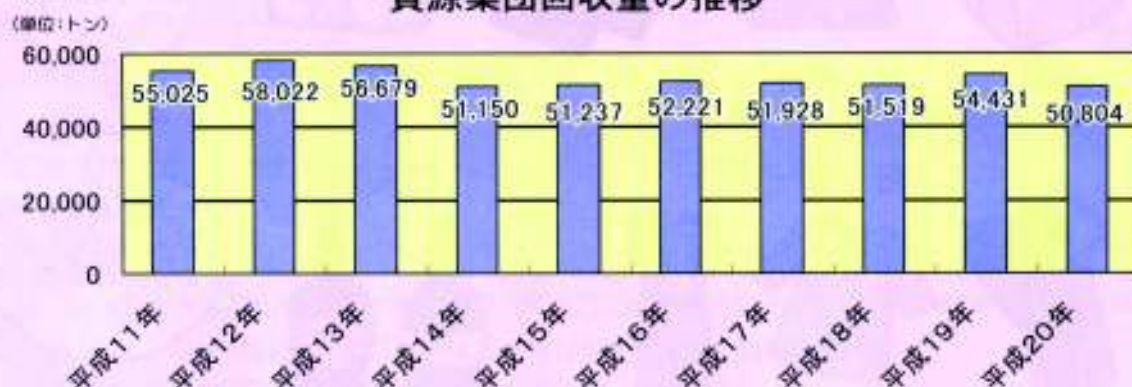
資源集団回収量の推移

平成20年の回収量は50,804トンとなっており、平成12年をピークに平成14年以降はほぼ横ばいで推移しています。