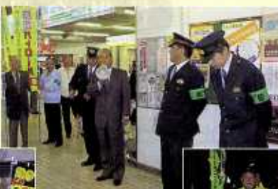
駅頭キャンペーン(金沢)