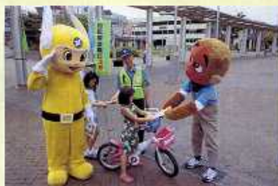
自転車盗防止 キャンペーン(都筑)