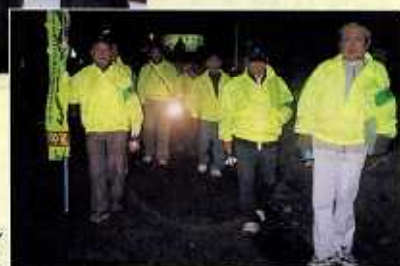
夜間パトロール (平塚)