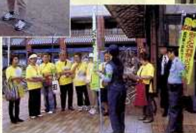
振り込め詐欺防止 キャンペーン (神奈川)