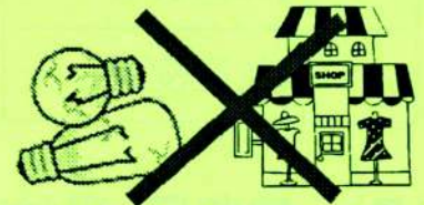
(白熱電球・割れた廃蛍光管・事業活動に伴うもの)