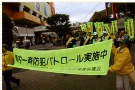
県内一斉防犯パトロール