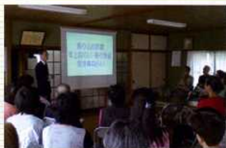
自治会での防犯教室の様子 (県央地域県政総合センター)

県では、「くらし安全指導員」による防犯教室を実施しています。皆さんのご要望に応じて、県内でしたら、いつでもどこでもお伺いします。もちろん料金はかかりません。