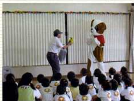
若ぐるみ誘拐防止寸劇の様子 (足柄上地域県政総合センター)