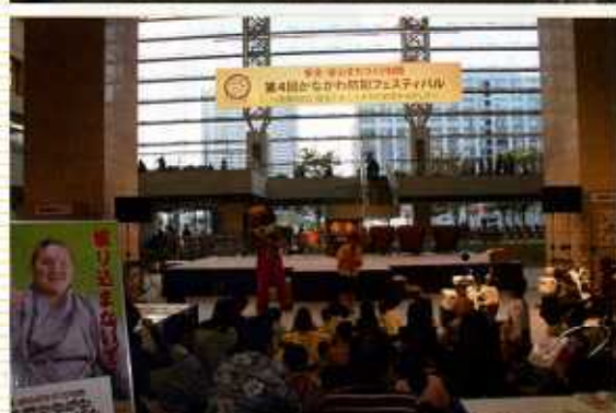
かながわ防犯フェスティバル